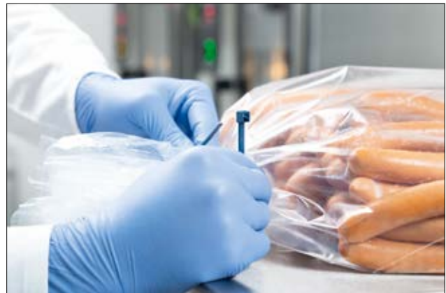
Wykrywalne opaski kablowe wielokrotnego użytku stosowane do wiązania czasowego.